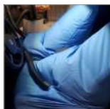
CVK32 Sacco per ozonizzazione sedili anteriori