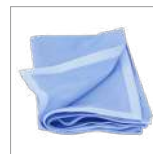
RIP1312 Sacco per ozonizzazione materassi/poltrone/ divani