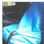
CVK62CW Sacco per ozonizzazione sedili posteriori