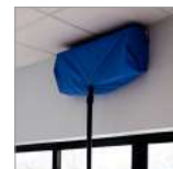
CVK32D Sacco per l'ozonizzazione dei condizionatori