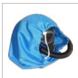
CVK32B Sacco per ozonizzazione caschi/borse/scarpe/ accessori