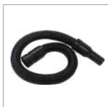
CVK10Z Tubo soffiaggio ozono